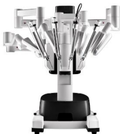
Da Vinci X-Operationssystem