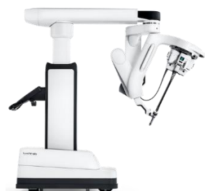
Da Vinci SP- (Single-Port) Operationssystem