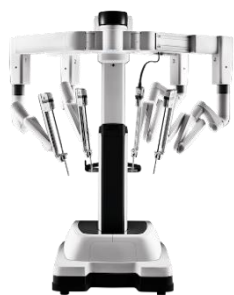
Da Vinci Xi-Operationssystem

wird weltweit ein Eingriff mit einem da Vinci-Operationssystem begonnen.