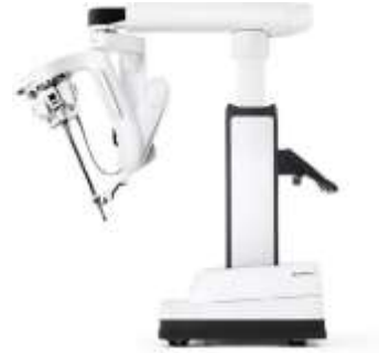
Système Chirurgical da Vinci SP (single port)*

Plus de 6 700 systèmes chirurgicaux da Vinci installés dans des hôpitaux du monde entier