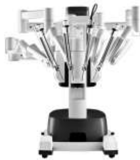
Système Chirurgical da Vinci X