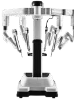
Système Chirurgical da Vinci Xi

Une liste des interventions et des applications courantes pour chacun de ces systèmes da Vinci est disponible dans le manuel d'utilisation correspondant.